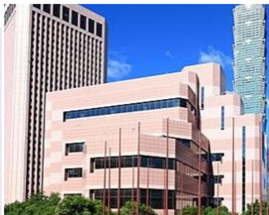
Taipei World Trade Exhibition Hall

Location ideale per varie tipologie di evento, può assumere diverse configurazioni