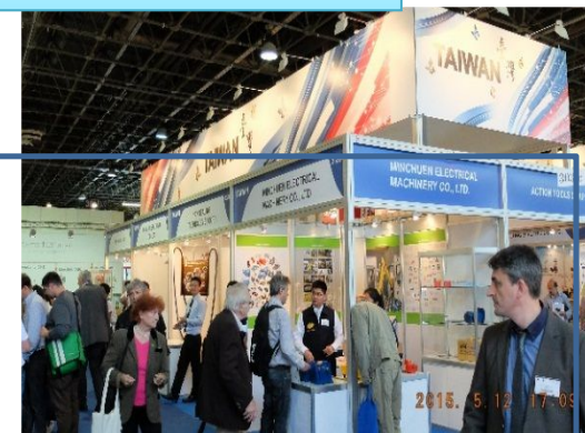
2015 Industry Days International Trade Exhibition in Hungary

TAITRA opera nei mercati globali attraverso