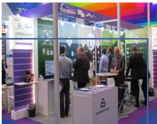
2015 IFSEC, UK

Padiglioni/Delegazioni di Taiwan presenti alle manifestazioni internazionali