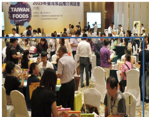
2015 China-Northeast Asia Expo