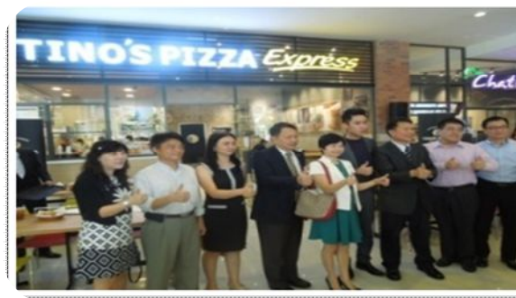
Apertura attività commerciali in franchising