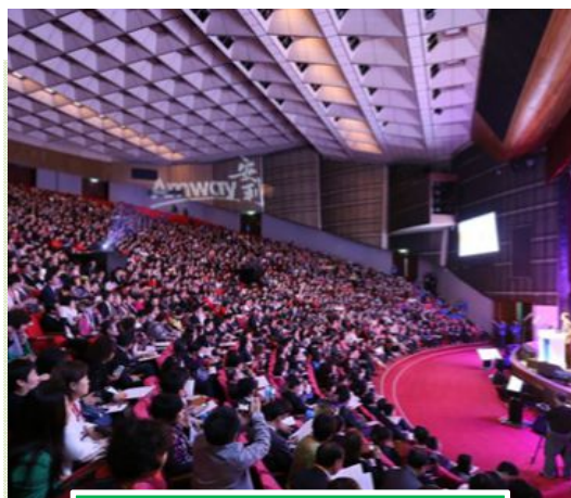
Taipei International Convention Center

Location ideale per varie tipologie di evento, può assumere diverse configurazioni