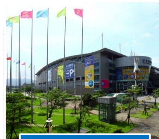
Taipei Nangang Exhibition Hall 1

Ha ottenuto la qualifica di “best practice” nelle 8 categorie identificate dal World Trade Centers Association