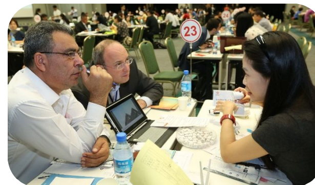
Informazioni e assistenza