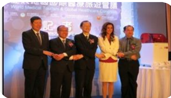
Promozione servizi medicali